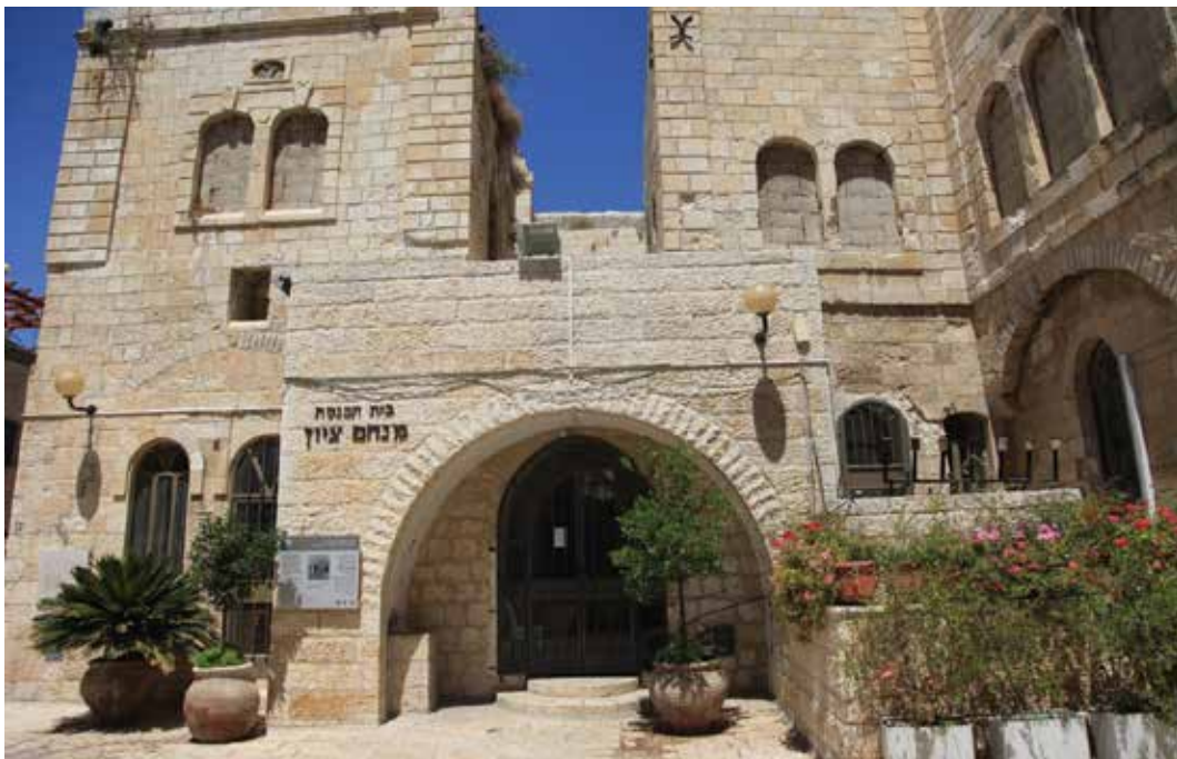
בית כנסת מנחם ציון

שוב, נשים לב: "החורבה" שנגאלה ב-1820 לא הייתה בית הכנסת, אלא החצר עצמה שבתוכה היה בית הכנסת האשכנזי הקדום, שעמד גם הוא בחורבנו.