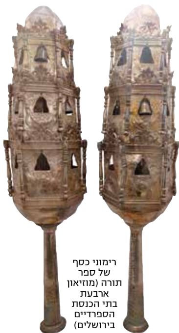
רימוני כסף של ספר תורה (מחזיאון ארבעת בתי הכנסת הספרדיים בירושלים)