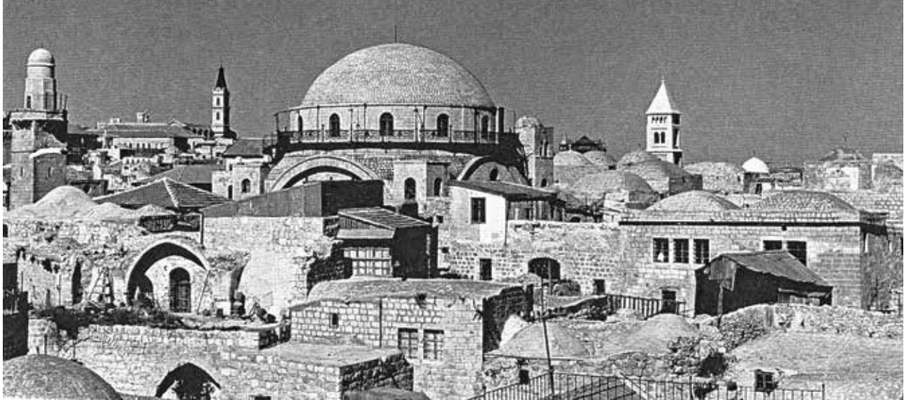
בית כנסת החורבה, 1940-1948

הכיל את המתפללים הרבים, ופעילי הקהילה השכילו לנצל את חולשתה של האימפריה העות'מאנית ואת הרפורמות שהנהיגה ביחסה לנתיני ארצות המערב כדי לקדם את הקמתו של בית כנסת גדול בתחומי חצר האשכנזים ההיסטורית, מעט מדרום לבית כנסת מנחם ציון. בנימוקי הבקשה שהוגשה לסולטאן לא שכחו לציין שבית הכנסת המתוכנן איננו חדש לגמרי, אלא עומד במקומו של בית כנסת קדמון שחרב. אולי התכוונו לבית כנסת הרמב"ן, שחורבותיו היו צמודות מדרום למבנה המיועד.