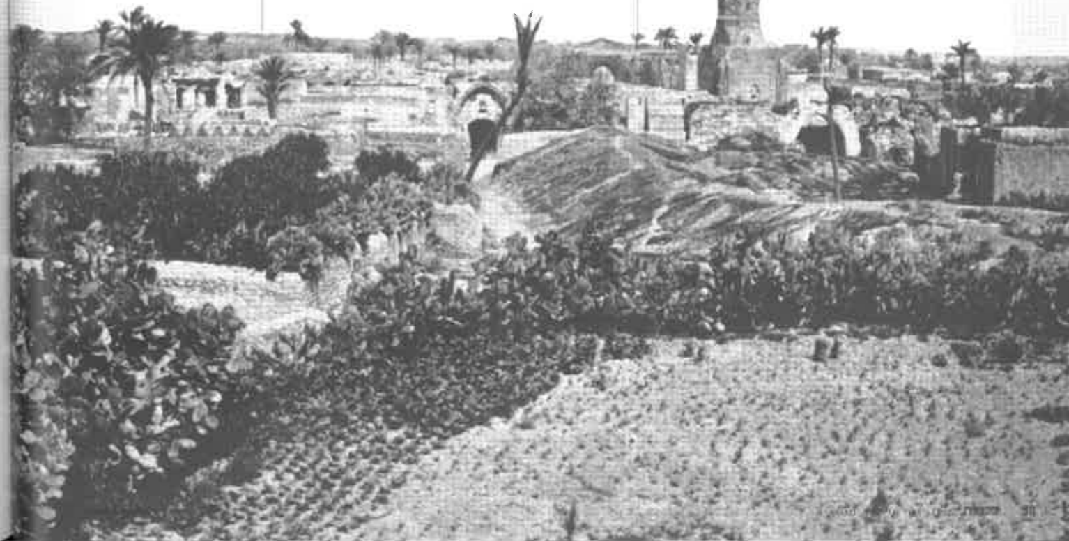
מבט ממזרח על הכניסה לעיר עזה שצריח של אחד מתמסדיה מתנשא מעליה. מרץ 1906 מאוסף ספריית הקונגרס

ואין שם רופא ולא שאר דברים הצריכין ... היהודים אשר שם הם מיעוטא דמעוטא לגבי היהודים אשר במצרים, ועוד שאין שם תלמוד תורה שונין הלכות, לא מאן דגמיר ולא מאן דסביר אפילו פותח ספר אין בה, והיאך יוציאה ממצרים שהוא מקום ריבוץ תלמידי חכמים ועיר גדולה של חכמים ושל סופרים? (שם).