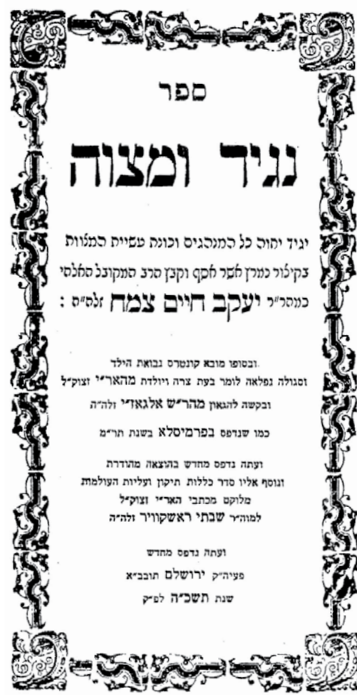
שער הספר 'נגיד ומצוה' מאת רבי יעקב צמח, אמסטרדם 1712. בספר מתואר האירוע שבו שתה רבי חיים ויטאל ממי 'באר מרים' שפתחו בפניו את שערי חכמת הסוד למטה: אתר 'באר מרים' בחוף טבריה, שנות העשרים של המאה העשרים בתמונה הקטנה: דיוקן של האר"י שהיה תלוי בבית הכנסת האר"י האשכנזי עד שנגנב ב-2010

לאחר מותו של האר"י החל רבי חיים ויטאל במלאכה שתעסיק אותו במשך שארית ימיו – כתיבה, מחיקה, עריכה מחדש וגניזה של כתבים רבים הכוללים חומר רב ועצום ששמעו הוא וחבריו המקובלים מפי האר"י. מדובר בפרויקט ענק שהוא בחר להוביל בעצמו וגם דרש עליו זכות יוצרים