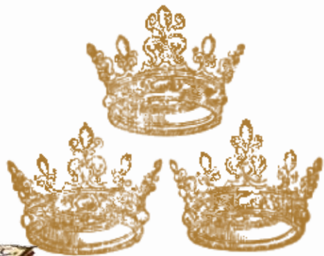
שני ראשי תלמידי חכמים היו סגליו שכתב לפתח שתי ותיבותיו הסודיות

הגדו הנאון מלכת חזר החכם השלם נהדר יוסף קארן טרזן מחרד אפרים קארן זצל איסר אור חזרתו וזרחת באור הזים בעיר צפת ת"ב ומעניי חזרתו נפוצות ביהודה ובישראל נודעו: וחבר הספר הזה קיצור שחיבורו הגדול אשר עשה על הארבעה טורים אשר קראם בית יוסף אשר בו כח מעשה חניד וכל יקר ראתה עש כרי שכל מבקש ה' ימצא מבוקשו בנקל כל דין ודין על טהורו באין אונס ואין רברים והכן לכל מטה ושלחן וכסא ומטרה אשר לאחד ילכו כח: כי מן מטרת רבי יוסף קב ונקי