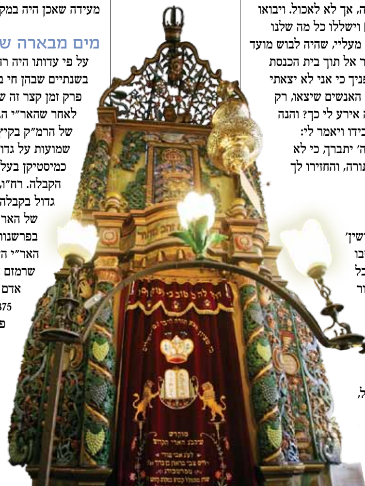
ארון הקודש של בית הכנסת האר"י האשכנזי