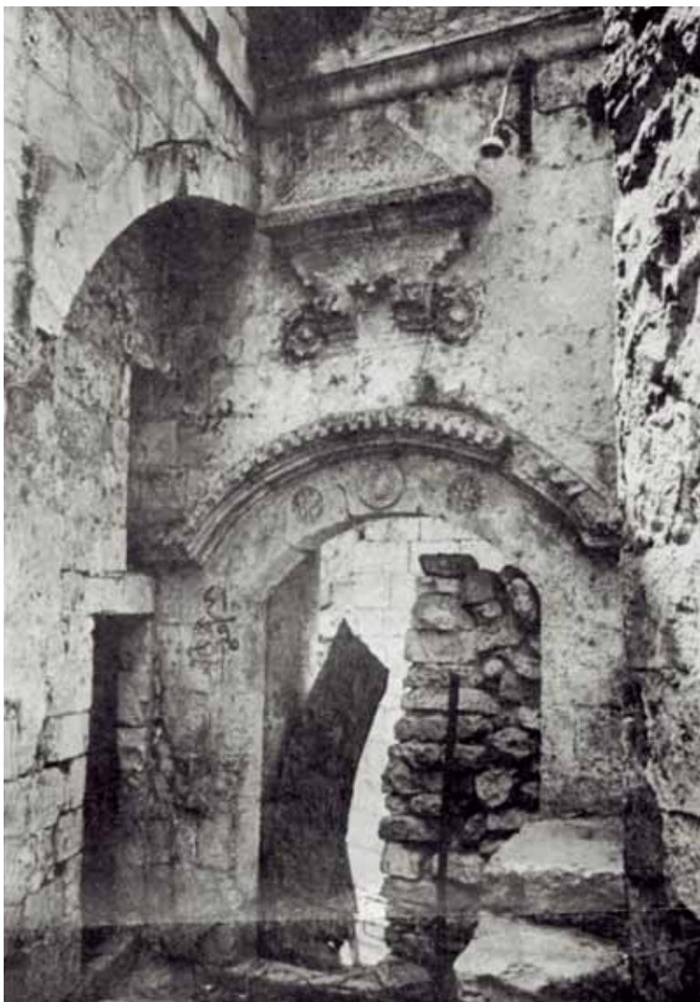
שער הכניסה לבית הכנסת האיסתנבולי (1967)