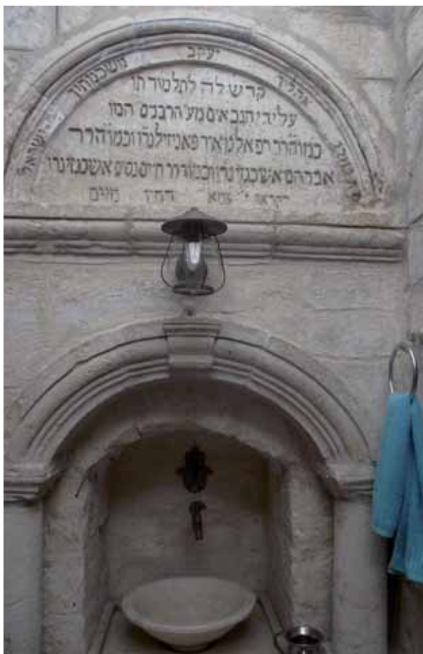
הכתובת המנציחה את תרומתם של הגבאים והרבנים

ר' רפאל מאיר פאניזיל מונה למשרת הראשון לציון בשנת 1880, כמה חודשים אחרי פטירתו של ר' אברהם