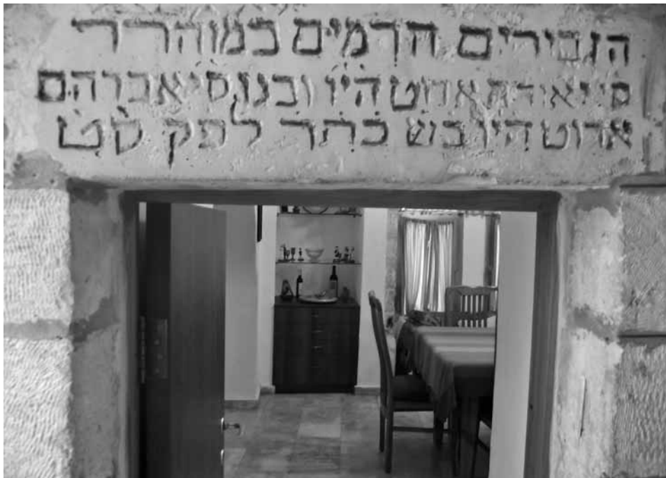
הכתובת המספרת על תרומת משפחת אדוט

אדוט הי"ו בש[נת] כ'ת'ר' לפ"ק ס"ט [סימן טוב]