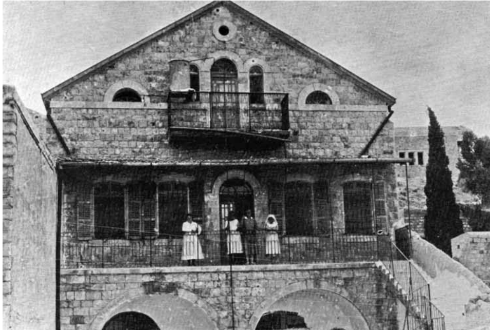
משמאל: בניין בית החולים 'משגב' ליד' בשנת 1915

בית חולים בירושלים להחזקת הישוב, נזדמן לו מיר לקנות את החצר הזו מיר ראשי ומנהלי העדה הספרדית במחיר 20,000 פ'ראנק. 22