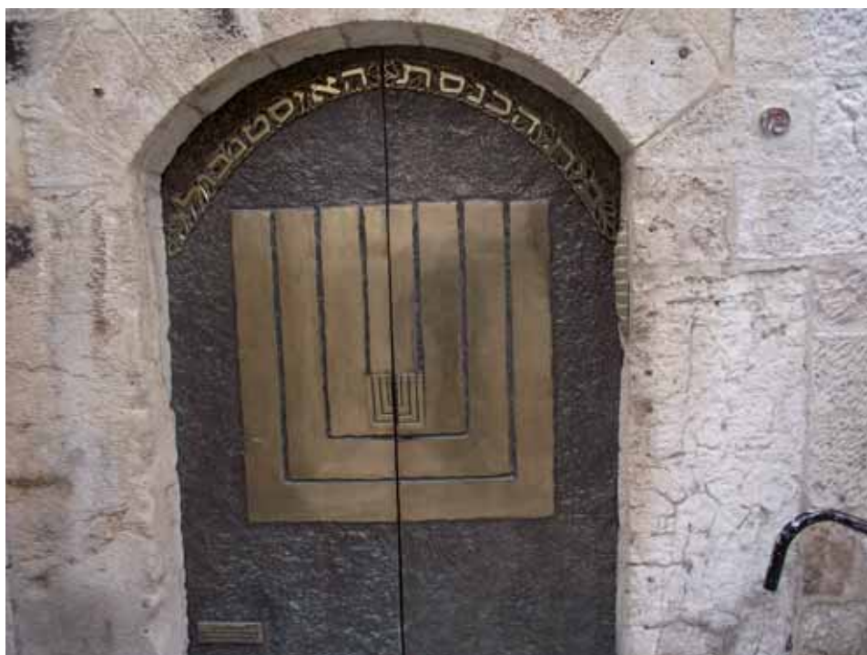
שער הכניסה לבית הכנסת האיטלקית מרחוב בית-אל (2011)